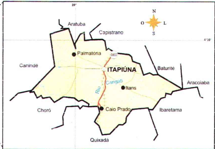
Situação do Município