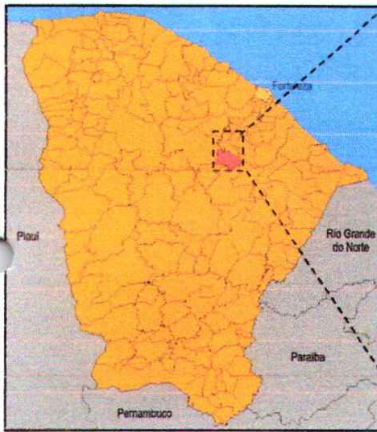
Localização do Município

Av. São Cristóvão, 215, Centro, Itapiúna-CE / CEP 62.740.000 tel. 0xx(88)34311210, fax 34311306 – CNPJ: 07.387.509/0001-88