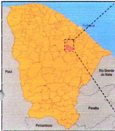
Localização do Município

Av. São Cristóvão, 215, Centro, Itapiúna-CE / CEP 62.740.000 tel. 0xx(88)34311210, fax 34311306 – CNPJ: 07.387.509/0001-88