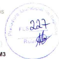
Tabela de Custos - Versão 026.1 - ENC. SOCIAIS 85,20%

C0331 - ATERRO C/COMPACTAÇÃO MANUAL S/CONTROLE, MAT. PRODUZIDO (S/TRANSP.)