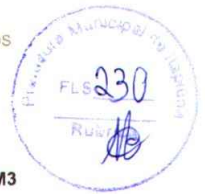
Tabela de Custos - Versão 026.1 - ENC. SOCIAIS 85,20%

C0089 - ANEL DE IMPERMEABILIZAÇÃO C/ARMAÇÃO EM FERRO