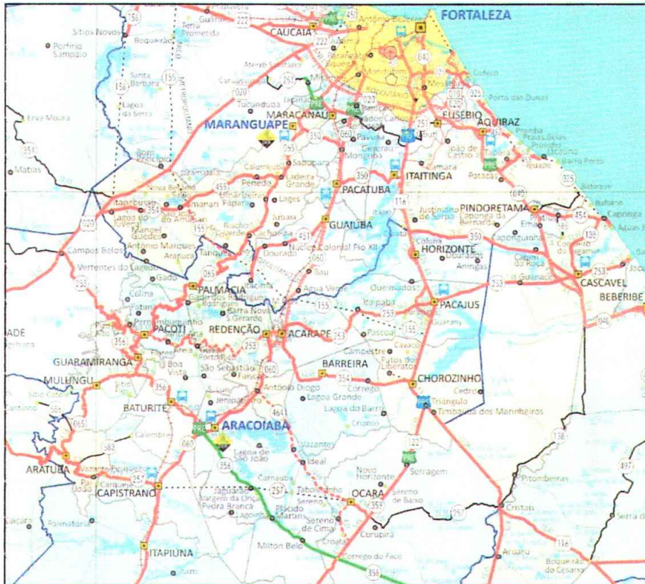
Acessos ao Município