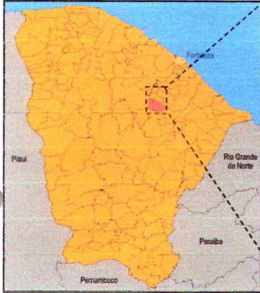
Localização do Município

Av. São Cristóvão, 215, Centro, Itapiúna-CE / CEP 62.740.000 tel. 0xx(88)34311210, fax 34311306 – CNPJ: 07.387.509/0001-88