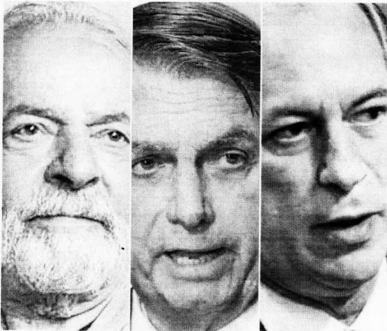
Lula, Bolsonaro e Ciro Gomes