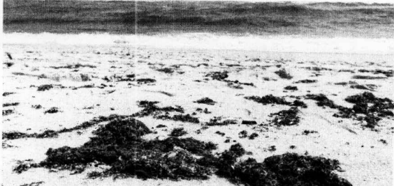
CERCA DE 64 PRAIAS do Estado haviam sido atingidas, até sexta-feira, 11