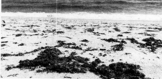
CERCA DE 64 PRAIAS do Estado haviam sido atingidas, até sexta-feira, 11