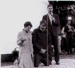
MICHELE E BOLSONARO se ajoelham durante culto em Minas Gerais

Durante participação em culto evangélico na manhã de ontem, a primeira-dama Michele Bolsonaro afirmou que o Palácio do Planalto já foi "consagrado a demônios". A fala foi durante discurso de Michele e milhares de fiéis na Igreja Batista Jaconi, em Belo Horizonte (MG). "Por muitos anos, por muito tempo, aquele lugar (Palácio do Planalto) foi um lugar consagrado a demônios. Cozinha consagrada a demônios, Planalto consagrado a demônios e hoje consagrado ao senhor Jesus. Ali, eu sempre falei e falo para ele (Bolsonaro), quando eu entro na sala e olho para essa cadeira é do presidente maior, é do rei que governa essa nação, disse a primeira-dama, ao lado do presidente Jair Bolsonaro.