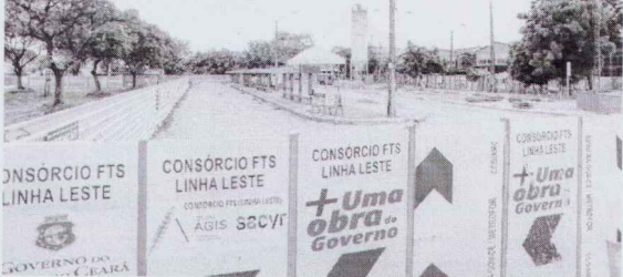
OBRAS da Linha Leste do Metrô de Fortaleza seguem em ritmo lento

Estado do Ceará - Prefeitura Municipal de Itapicirama - Anexo de Licitação - Pregão Eletrônico nº 001/2022 - C.P. - Processo de Compra de Materiais para a Manutenção e Conservação Pública nº 01.041/2022-C.P. - Processo de Compra de Materiais para a Manutenção e Conservação Pública nº 01.041/2022-C.P. - Processo de Compra de Materiais para a Manutenção e Conservação Pública nº 01.041/2022-C.P.