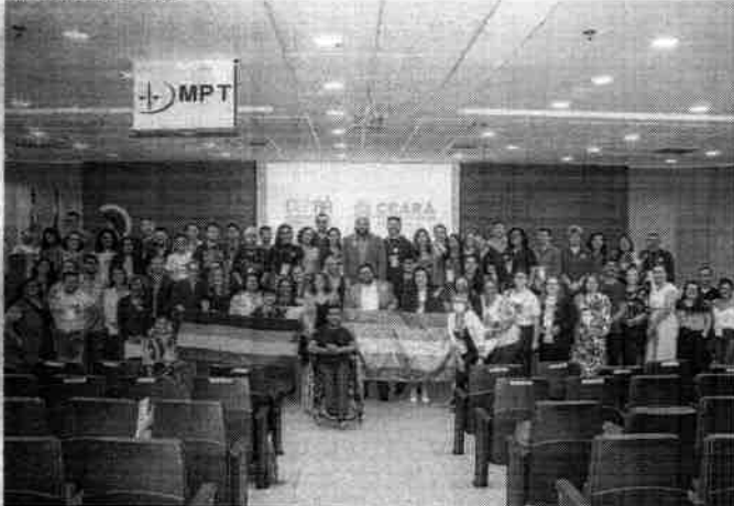
GRUPO reunirá instituições das esferas civil, pública e privada

KLEBER CARVALHO ESPECIAL PARA O POVO jsoa.kleber@povo.com.br