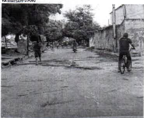
CHACINA no Lagamar deixou quatro mortos há um ano

LUCAS BARBOSA lucasbarbosaarap@povo.com.br