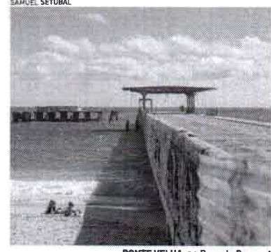
PONTE VELHA, no Poço da Draga, fechada após parte da estrutura desabar

PRAIA DE IRACEMA | O POVO esteve no local na manhã do domingo, 6, e observou frequência normal de banhistas na área do Poço da Draga