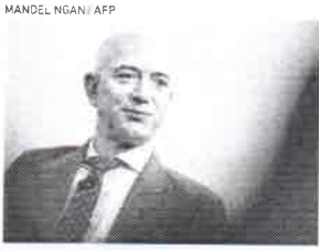
JEFF BEZOS, dono da Amazon, redefiniu o comércio de livros e o varejo

Começou num galpão em Seattle vendendo livros pela internet e logo de que deu. Bezos revolucionou o mercado de livros e o próprio varejo. Entrega rápida e dá descontos. Hoje a Amazon é a maior livraria do mundo.