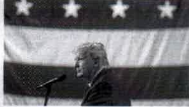
TRUMP recorrerá da decisão na Suprema Corte dos EUA

A Suprema Corte do Colorado emitiu ontem, 19, uma decisão que barra o ex-presidente americano Donald Trump de aparecer na cédula de votação das primárias do Partido Republicano, neste Estado, no próximo ano.