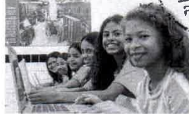
PROGRAMA busca levar conectividade para uso pedagógico nas escolas públicas