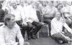
CID e CAMILO cederam as cadeiras para outras autoridades e ficam sentados no chão no evento de filiação ao PSB