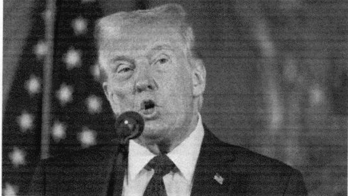
DESDE que foi eleito Trump já ameaçou taxar vários países e a União Europeia